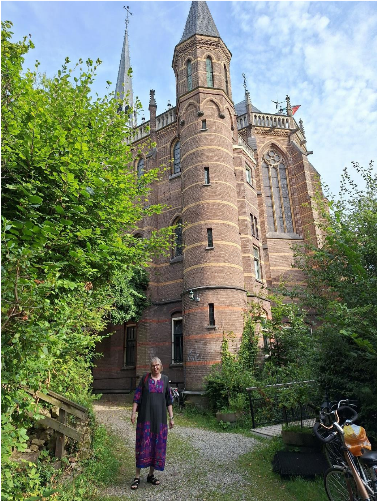
Prinses Ellie bij kasteel Elegast