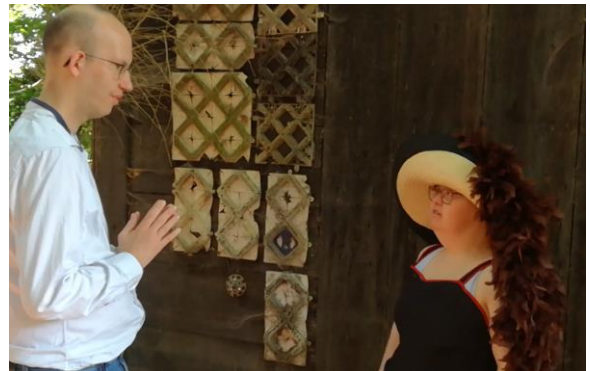
Daarna vind hij prinses Wietske in Schotland en vervolgens prinses Lucia in Duitsland.