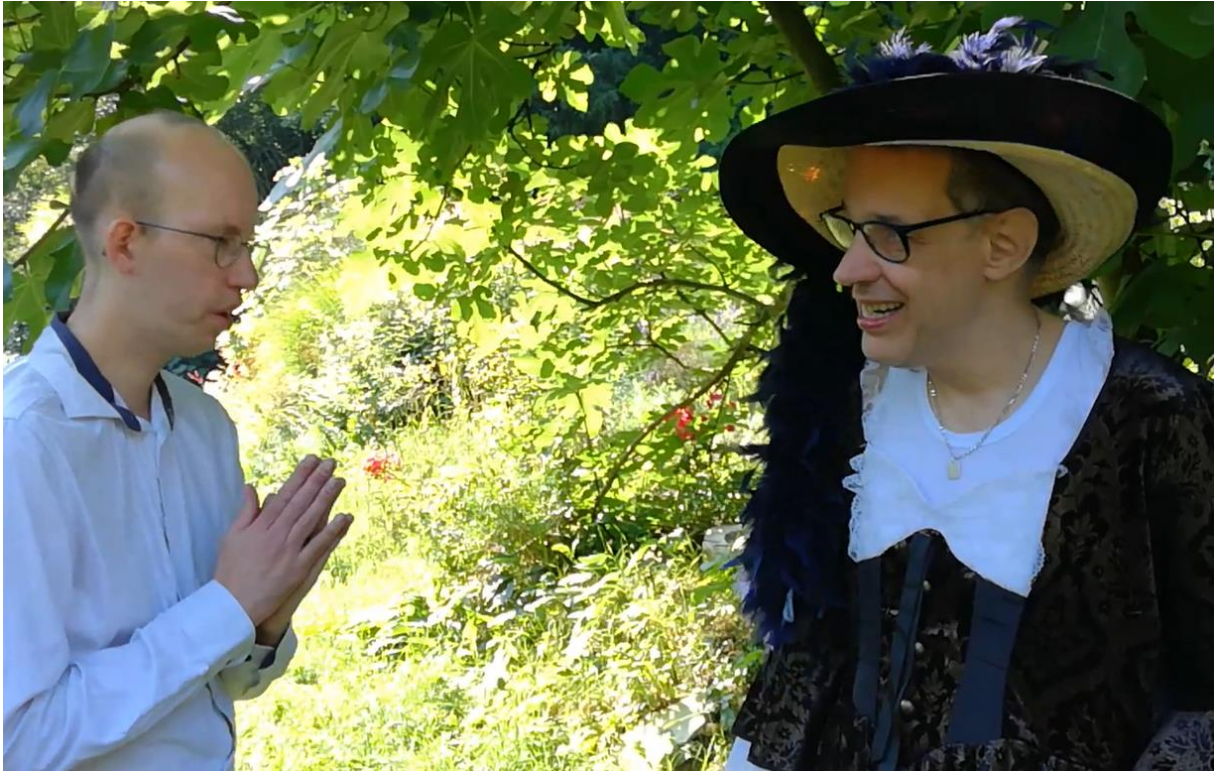
Hier zie je hoe ze elkaar begroeten.